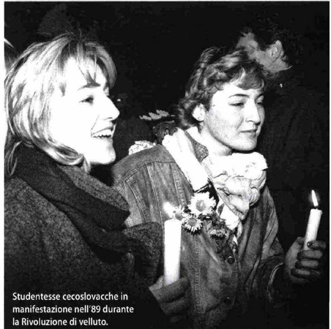
Studentesse cecoslovacche in manifestazione nell'89 durante la Rivoluzione di velluto.

Dal 1911 al 1931 gli italiani tentarono di sottomettere la Libia, acquisita dopo la Guerra italo-turca. A un certo punto il conflitto si trasformò in guerriglia, soprattutto a causa dei resistenti libici guidati dal sessantenne Omar al-Mukhtar. Negli Anni '20 la reazione del