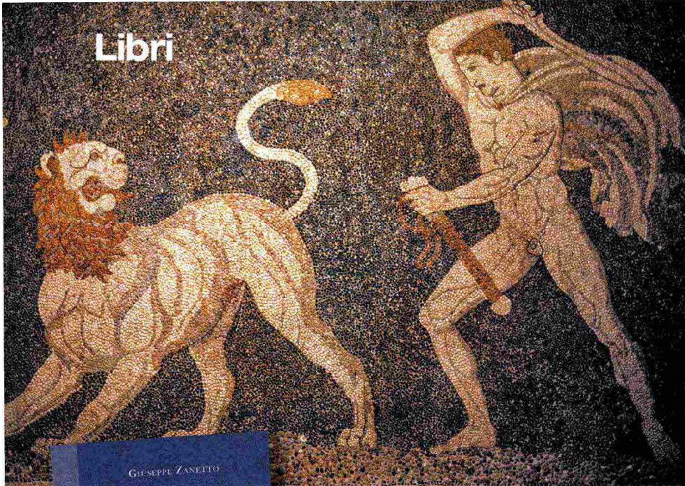
A FIANCO: mosaico con la caccia al leone, dettaglio con Cratero, dalla Casa di Dioniso, Pella, Museo archeologico.