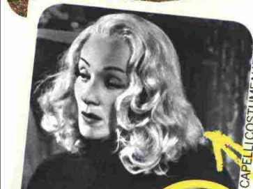
CAPELLI COSTUME NATIONAL