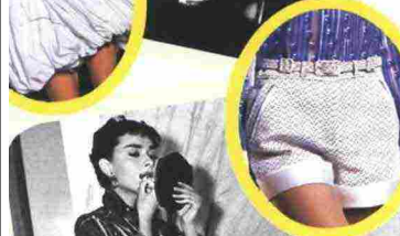
SHORTS E CAMICIA CARVEN