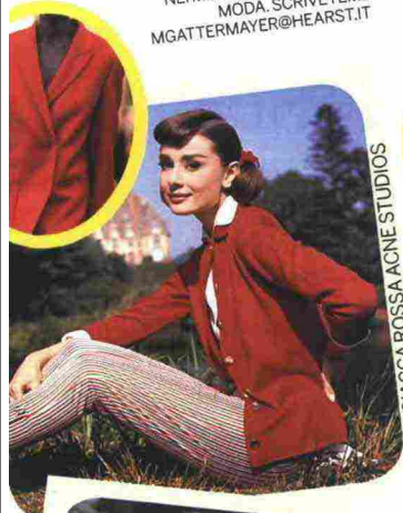
GIACCA ROSSA AGNE STUDIOS