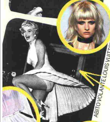
ABITO VOLANTE LOUIS VUITTON