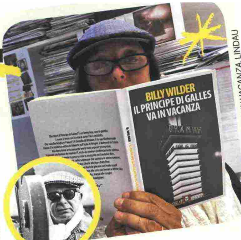
IL PRINCIPE DI GALLES VA IN VACANZA, LINDAU