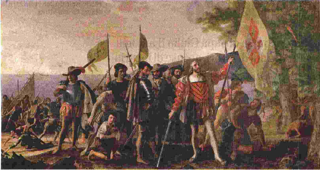
COLONIALISMO Lo sbarco di Colombo di John Vanderlyn. Sotto, la copertina del libro di Rodney Stark