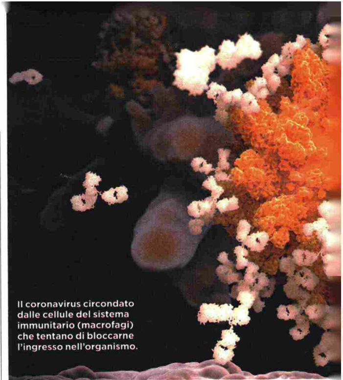
Il coronavirus circondato dalle cellule del sistema immunitario (macrofagi) che tentano di bloccarne l'ingresso nell'organismo.

Un altro studio, condotto da un team di Amsterdam e apparso sul sito Medrxiv, indica che la protezione naturale dell'organismo nei confronti del Sars-Cov-2 si perde nel giro di sei mesi circa. E ancora più sconcertanti le conclusioni di un team cinese della Scuola di medicina della Nanjing University, che per sette settimane ha monitorato il livello di anticorpi in 19 pazienti non gravi e in sette in condizioni più serie. Quasi il 20 per cento (in pratica, uno su cinque) dopo circa un mese non aveva più tracce di difese neutralizzanti.