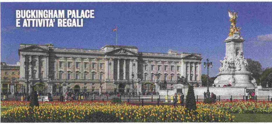
BUCKINGHAM PALACE E ATTIVITÀ REGALI

servizio pubblico, abbia sviluppato una profonda conoscenza del genere umano e, ancor più importante, conosce e capisce la politica internazionale meglio di chiunque altro.