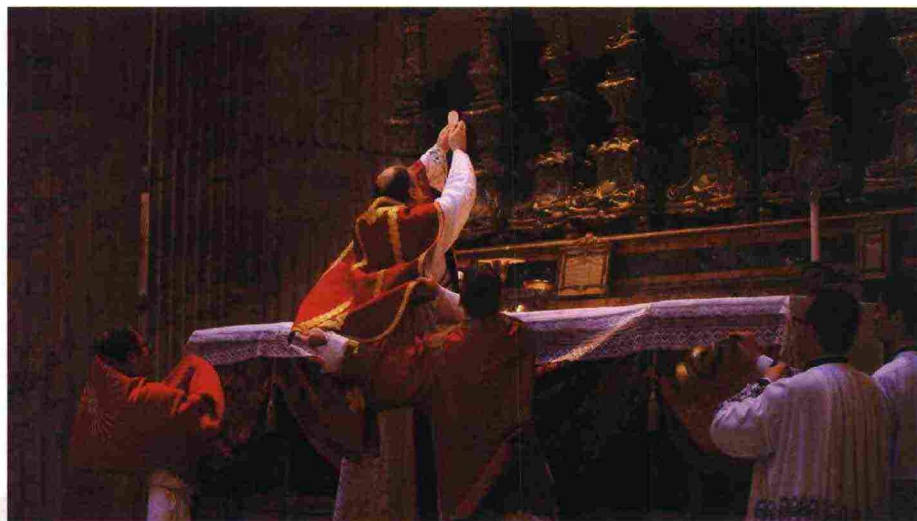
Il pontificato di san Pio V è caratterizzato dall'istituzione, nel 1570, della Messa, che era destinata a entrare nella storia come "tridentina", pur non essendo altro che la restaurazione della Messa tradizionale, devastata dal protestantesimo.

Il suo pontificato è segnato da alcune decisioni fondamentali: nel 1566 la pubblicazione del Catechismo , che esponeva in termini chiarissimi tutta l'opera dottrinale del Concilio di Trento; nel 1568 la promulgazione del Breviario romano , che è il libro liturgico che contiene l'Ufficio Divino della Chiesa cattolica; nel