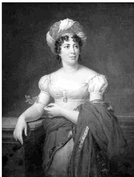
Ritratto di Madame de Staël, olio su tela di François Gérard e Marie-Éléonore Godefroid, (Castello di Versailles)