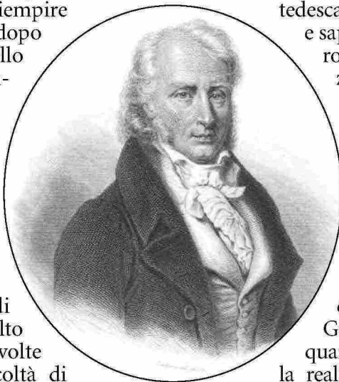
Ritratto di Benjamin Constant, incisione di Laderer

no celebre, celebrità che naturalmente amplifica il suo seguito e la sua influenza. E poiché nonostante i buoni uffici del padre, l'ostilità nei confronti di Napoleone cresce e guadagna consensi, Germaine viene esiliata, prima da Parigi e poi dalla Francia.