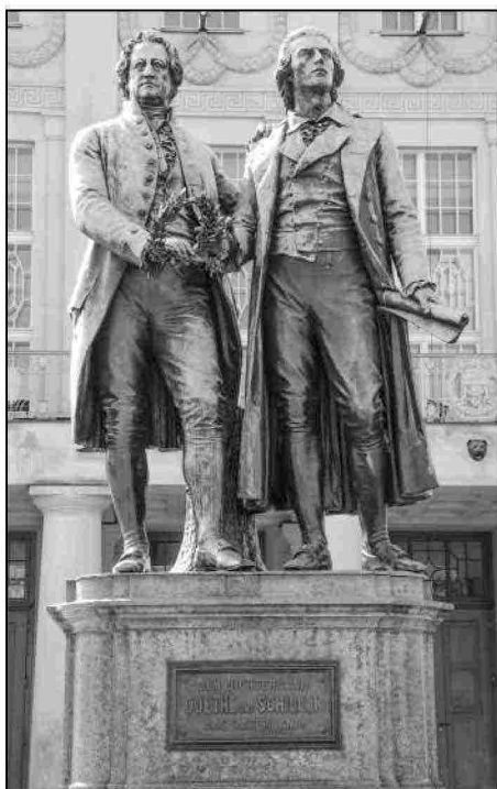
Il monumento ai due grandi di Weimar, Goethe e Schiller

la descrizione, spesso molto divertente, ricavata da lettere e diari dei contemporanei e dei protagonisti stessi, nella biografia che ho dedicato a Madame de Staël, da poco uscita presso le edizioni Lindau: Madame de Staël, la donna che ha cambiato la cultura europea . Madame de Staël aveva fama di donna di grande spirito, cultura e intelligenza, nonché di coraggiosa perseguitata da Napoleone, ma anche di donna impegnativa dotata di una estenuante parlantina che sfiniva i suoi interlocutori. Voleva saper tutto, capire tutto, indagare tutto e non si fermava finché non aveva raggiunto il suo scopo.