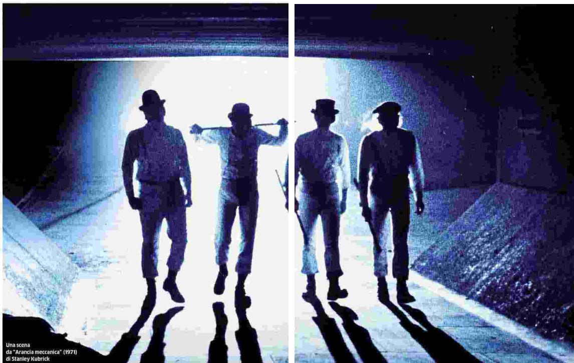
Una scena da "Arancia meccanica" (1971) di Stanley Kubrick

Michel Ciment e Antoine De Gaudemar del 2011, utilizzando anche gli audio delle interviste realizzate dall'illustre critico francese (importante anche la sua monografia pubblicata per la prima volta nel 1978), riprese anche nel recente "Kubrick by Kubrick" (2020) di Gregory Monro. N. FAL.