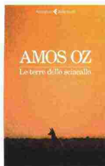
LE TERRE DELLO SCIACALLO DI AMOS OZ, FELTRINELLI, 18 EURO

È il libro con cui nel 1965 Amos Oz, scrittore israeliano scomparso nel 2018, si è fatto conoscere, la sua prima raccolta di racconti che viene finalmente tradotta in italiano. Dieci storie nate dalla sua esperienza nei kibbutz dove aveva scelto di vivere dai 15 anni in poi, lasciando la famiglia. I protagonisti sono uomini e donne che inseguono un'utopia cercando di costruire una realtà diversa, ma spesso si dimostrano anime piccole e assetate di dominio e potere.